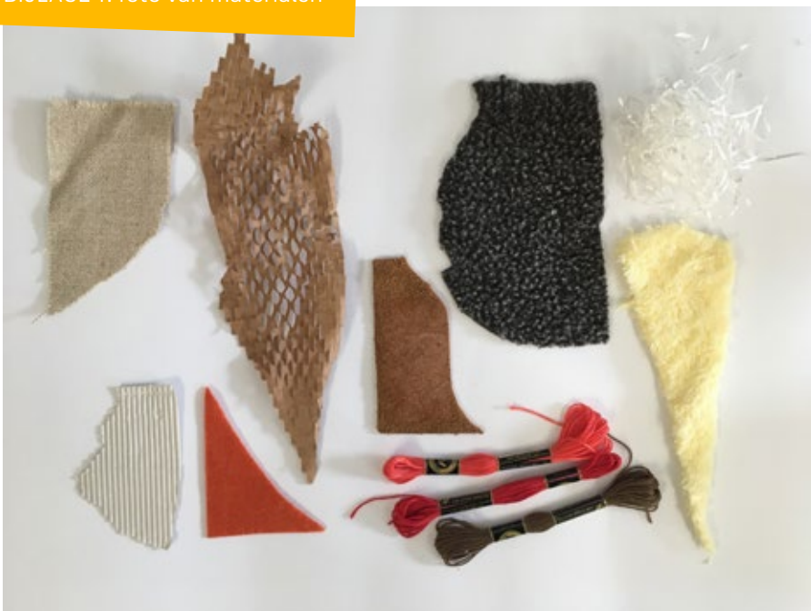
Foto: textiel, verpakkingsmateriaal, fleece met vachtttextuur, papierslierten, leer, nepbont, golfkarton, vilt, draad.