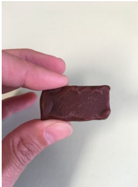
Foto: blokje was van ongeveer 1 bij 2 cm.