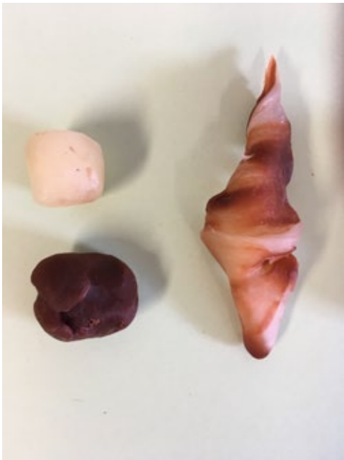
Foto: was bestaat in verschillende tinten. Bruin kun je ook mengen met wit. Zo krijg je verschillende kleurtonen.