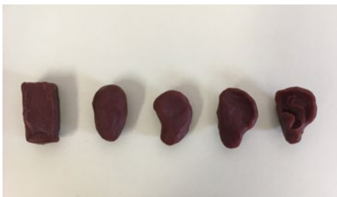
Foto: geboetseerd oor stap voor stap.

Bekijk hier het instructiefilmpje over de boetseertechniek met was.