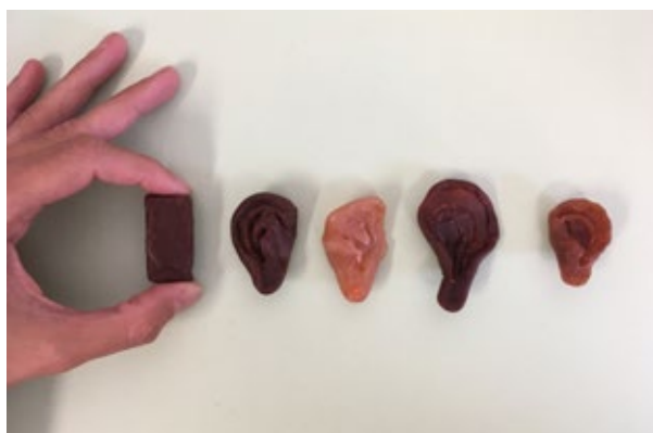
Foto: impressie verschillende wassen oren.