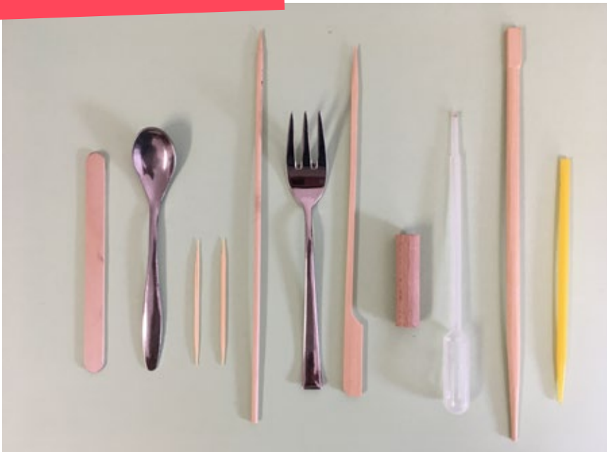
Foto: voorbeelden kosteloos materiaal om te gebruiken als boetseergereedschap.